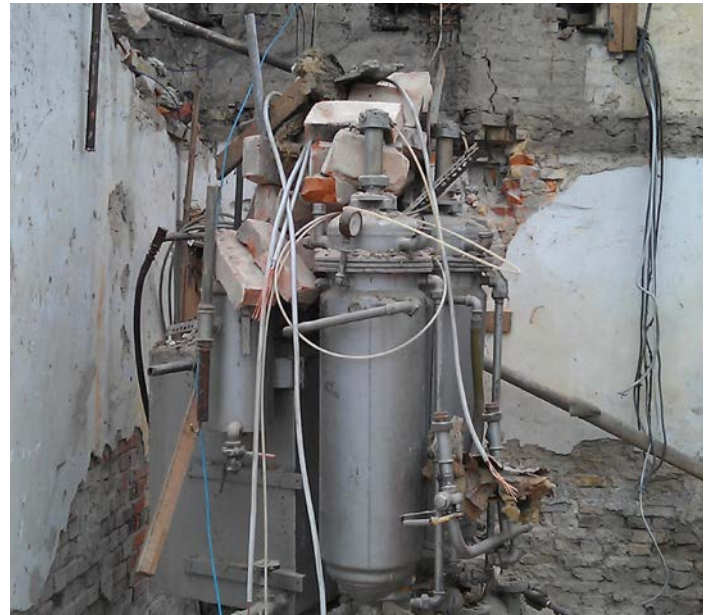
Oprydning af forurening fra et tidligere rensier.

Udover ovennævnte indsatser arbejder vi i 2017 også med videregående undersøgelser og oprensninger, der er sat i gang i tidligere år.