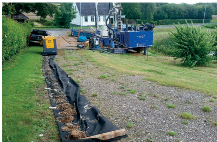
Borearbejdet i partnerskabsprojektet Odense Vest.

Som et led i prioriteringen af indsatsen fremover har vi inddelt regionen i 45 delområder. Inddelingen betyder, at regionen kan påbegynde en indsats i flere delområder samtidig. Områderne kan ændres eller nedprioriteres i samråd med kommuner og vandforsyninger. Dette kan ske,