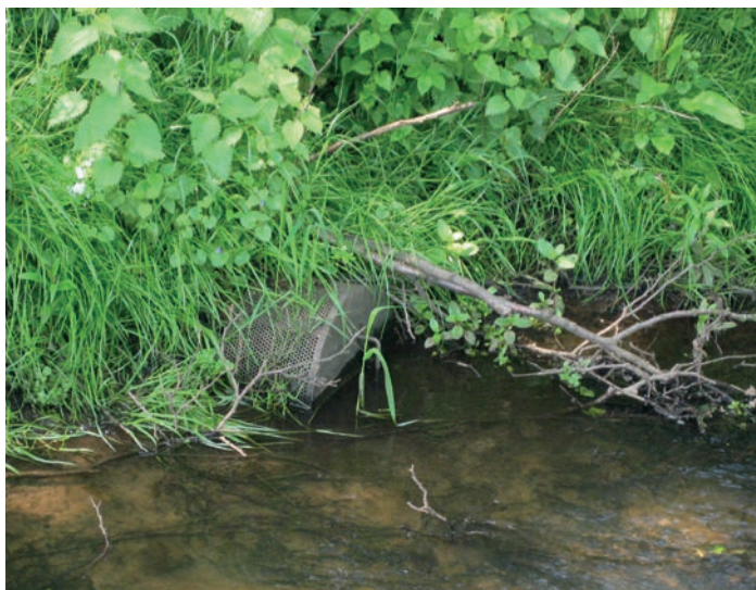
Regionen har indsats over for forureninger der påvirker overfladevand.

Region Syddanmark er en del af et nationalt netværk af testgrunde. Netværket er etableret for at tilskynde virksomheder, forsknings- og undervisningsinstitutioner til at udvikle nye teknikker og teknologier til undersøgelse og oprensninger af jord- og grundvandsforureninger. Samlet repræsenterer grundene en bred vifte af forureningsproblematikker. Region Syddanmark har stillet to testgrunde til rådighed, henholdsvis en tidligere Tjære- og Asfaltfabrik i Ringe samt et tidligere renseri på Middelfartvej i Odense.